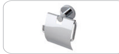
312020 Geniş Kapaklı Kağıtlık 29.10 TL