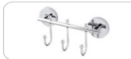
312033 Rozetli 3'lü Askılık 49.00 TL