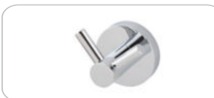
312017 Çatal Bornozluk 17.60 TL