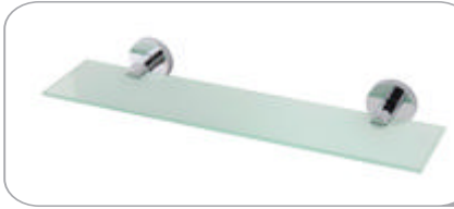
312013 Etajer 34.70 TL