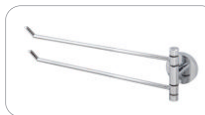
312037 2'li Döner Havluluk 41.50 TL