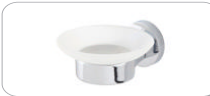
312014 Sabunluk 26.40 TL