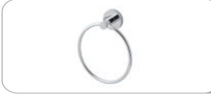
312012 Yuvarlak Havluluk 17.50 TL