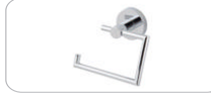
312018 Kapaksız Kağıtlık 23.80 TL