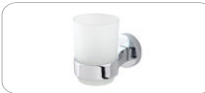
312015 Diş Fırçalık 26.80 TL