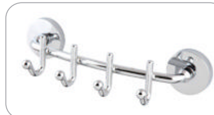
312036 Rozetli Lüks 4'lü Askılık 35.30 TL