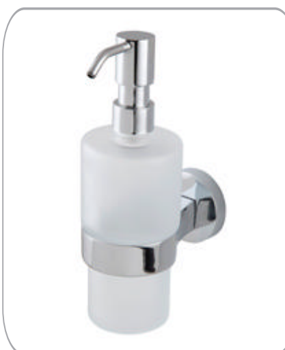
312040 Cam Sıvı Sabunluk 44.60 TL