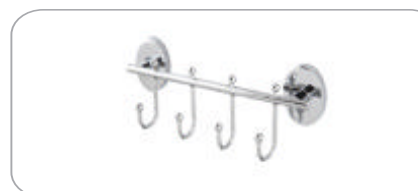
312034 Rozetli 4'lü Askılık 52.00 TL