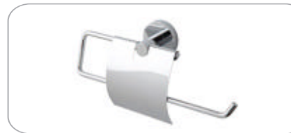
312023 Geniş Kapaklı Kağıt Havluluk 33.70 TL