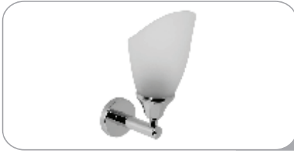
212030 Duvardan Tekli Aplik 35.00 TL