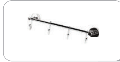
212034 4 lü Askılık 33.00 TL