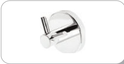
212017 Çatal Bornozluk 16.10 TL