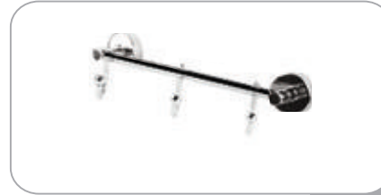
212033 3 lü Askılık 30.00 TL