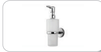
212025 Cam Sıvı Sabunluk Montajlı 41.00 TL