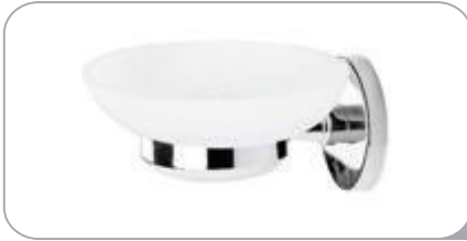
212014 Sabunluk 17.10 TL