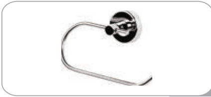
212018 Kapaksız Kağıtlık 17.00 TL