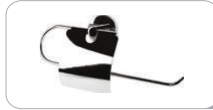
212023 Geniş Kapaklı Kağıt Havluluk Kapak 304 Paslanmaz 25.00 TL