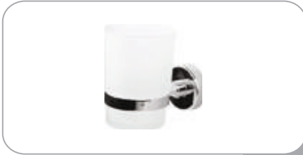
212015 Diş Fırçalık 17.30 TL