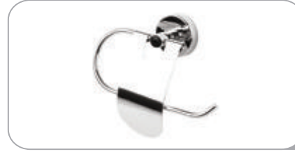
212019 Dar Kap. Kağıtlık Kapak 304 Paslanmaz 21.00 TL 212019P Dar Kap. Kağıtlık Kapak Pirinç 24.00 TL