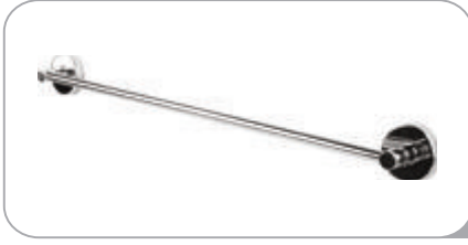
212011 Uzun Havluluk Paslanmaz Boru 20.20 TL