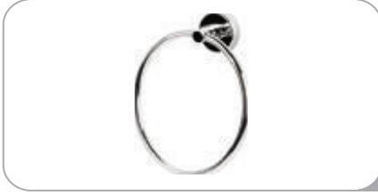
212012 Yuvarlak Havluluk Paslanmaz Boru 16.00 TL