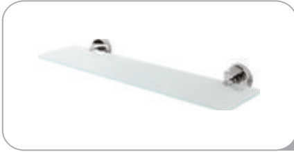
212013 Etajer 21.00 TL