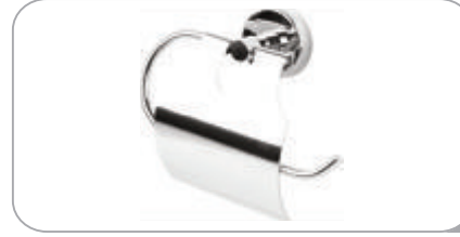
212020 Geniş Kap. Kağıtlık Kapak 304 Paslanmaz 22.00 TL 212020P Geniş Kap. Kağıtlık Kapak Pirinç 26.50 TL