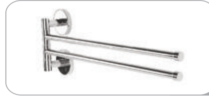
212026 Çift Rozetli Döner Havluluk 56.00 TL