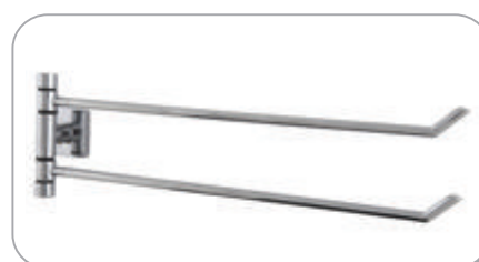
152037 2'li Döner Havluluk 31.40 TL