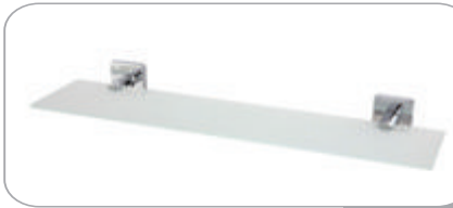
152013 Etajer 26.10 TL