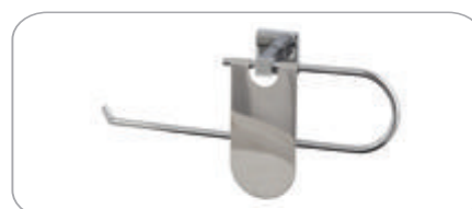
152022 Dar Kapaklı Kağıt Havluluk 24.00 TL