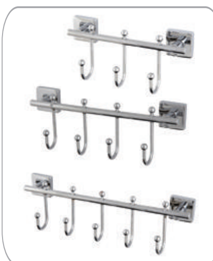
152033 Rozetli 3'lü Askılık 28.00 TL