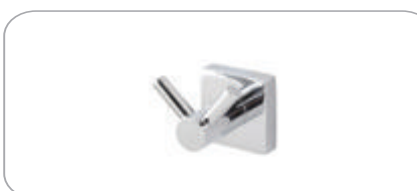
152031 Çatal Bornozluk 12.50 TL