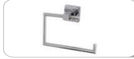
152018 Kapaksız Kağıtlık 15.10 TL