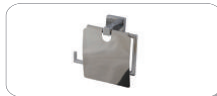
152020 Geniş Kapaklı Kağıtlık 16.70 TL