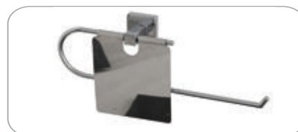
152023 Geniş Kapaklı Kağıt Havluluk 24.90 TL