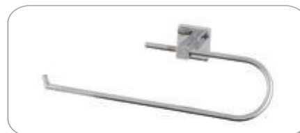
152021 Kapaksız Kağıt Havluluk 22.80 TL