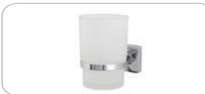
152015 Diş Fırçalık 14.20 TL