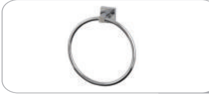
152012 Yuvarlak Havluluk 18.50 TL