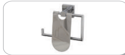
152019 Dar Kapaklı Kağıtlık 15.80 TL