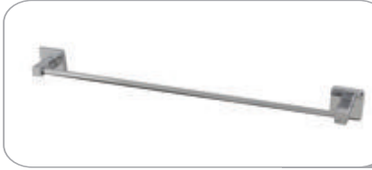
152011 Uzun Havluluk 25.50 TL