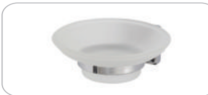
152014 Sabunluk 14.20 TL