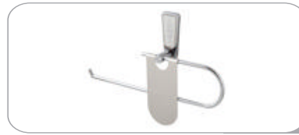
142022 Dar Kapaklı Kağıt Havluluk 13.80 TL