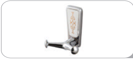
142017 Çatal Bornozluk 9.70 TL