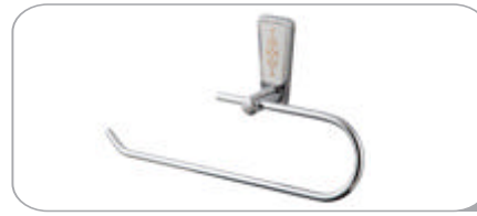
142021 Kapaksız Kağıt Havluluk 12.20 TL