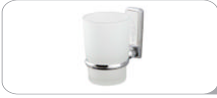
142015 Diş Fırçalık 10.70 TL