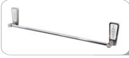
142011 Uzun Havluluk 15.70 TL