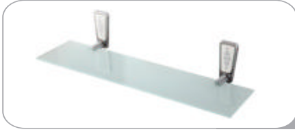
142013 Etajer 15.70 TL