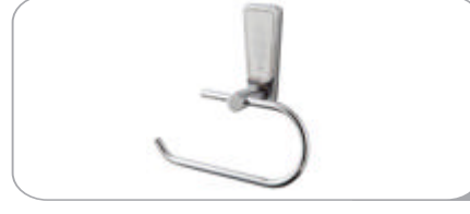
142018 Kapaksız Kağıtlık 10.80 TL