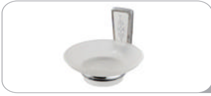
142014 Sabunluk 10.70 TL