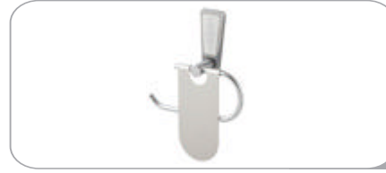
142019 Dar Kapaklı Kağıtlık 11.90 TL