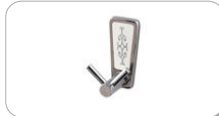
142031 Mini Çatal Bornozluk 10.60 TL