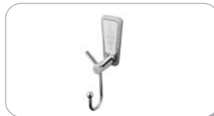
142032 Mini 3'lü Bornozluk 13.50 TL