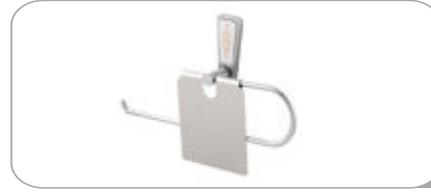
142023 Geniş Kapaklı Kağıt Havluluk 14.60 TL