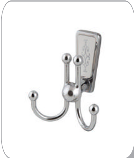
142030 Lüks 2'li Bornozluk 16.60 TL