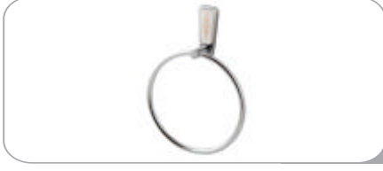
142012 Yuvarlak Havluluk 10.00 TL