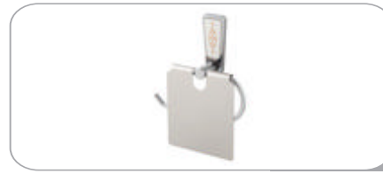
142020 Geniş Kapaklı Kağıtlık 12.90 TL