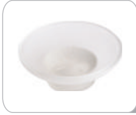
YCS01 Sabunluk Camı