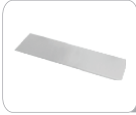
YCE01 Etajer Camı 40x10