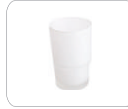
YCD01 Diş Fırçalık Camı