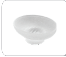
YCS02 Oval Sabunluk Camı