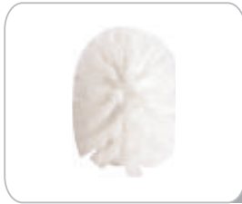
YMKF01 Kıl Fırça