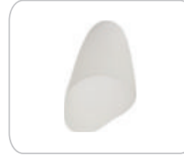
YCA01 Aplik Camı