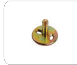
YMMAZ01 Montaj Aparatı Zamak